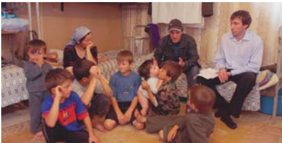
Семья временно перемещенных лиц из Чечни в одном из временных поселений в Ингушетии

том, что эти люди осведомлены об имеющихся у них вариантах переселения и что на них не оказывают давление.